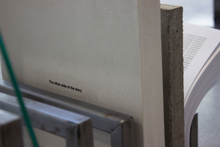
Dokumentation av verket Cultural lag (Archive) , 2019.