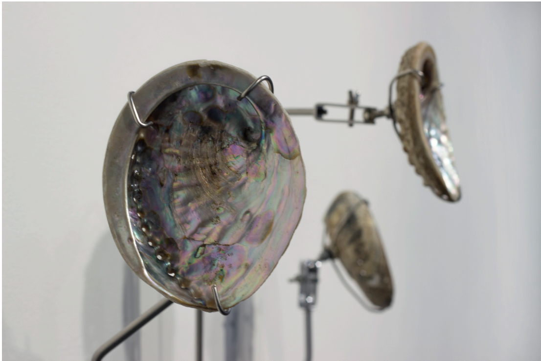
Dokumentation av verket Every whisper in a distance , 2020.